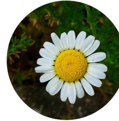
Camomille romaine ( Chamaemelum nobile )