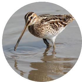
Bécassine des marais ( Gallinago gallinago )