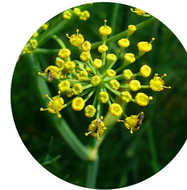
Fenouil commun ( Foeniculum vulgare )