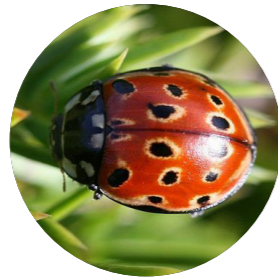
Coccinelle à ocelles ( Anatis ocellata )