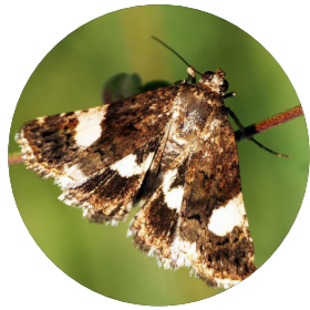
Noctuelle en deuil ( Tyta luctuosa )