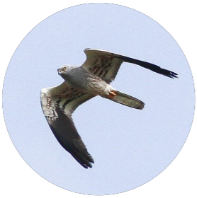
Busard cendré ( Circus pygargus )