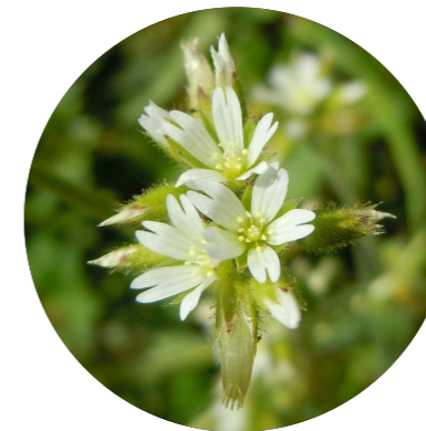
Céraiste diffuse, Céraiste à quatre étamines ( Cerastium diffusum )