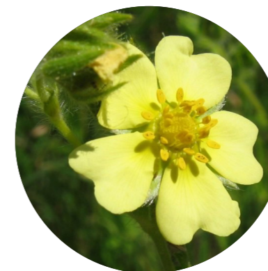
Potentille dressée, Potentille droite ( Potentilla recta )